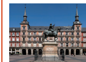
Tour Madrid Antiguo Jueves 29 (mañana)