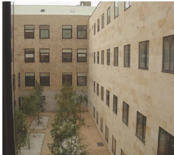
Sede de la Oficina Judicial de León