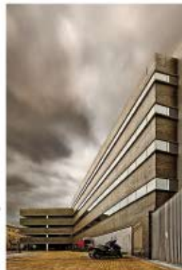
Hotel Puerta de los Aljibes*****