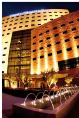
Nazaríes Bussinnes & Spa*****